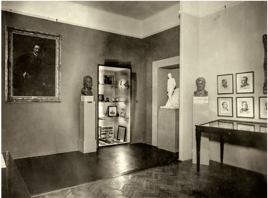
Tisza István korának emlékei Magyar Nemzeti Múzeum Történeti Fényképtár