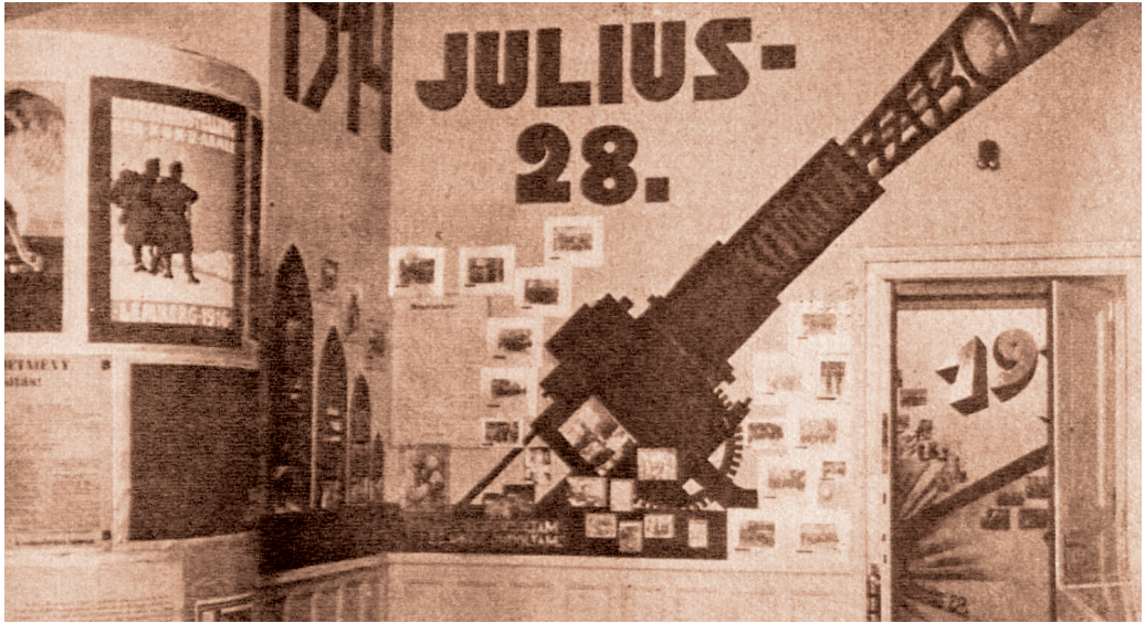
A 20 év politikai története című kiállítás installációi Magyar Nemzeti Levéltár Országos Levéltára