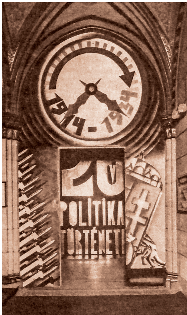
A 20 év politikai története című kiállítás bejáratának installációja Magyar Nemzeti Levéltár Országos Levéltára