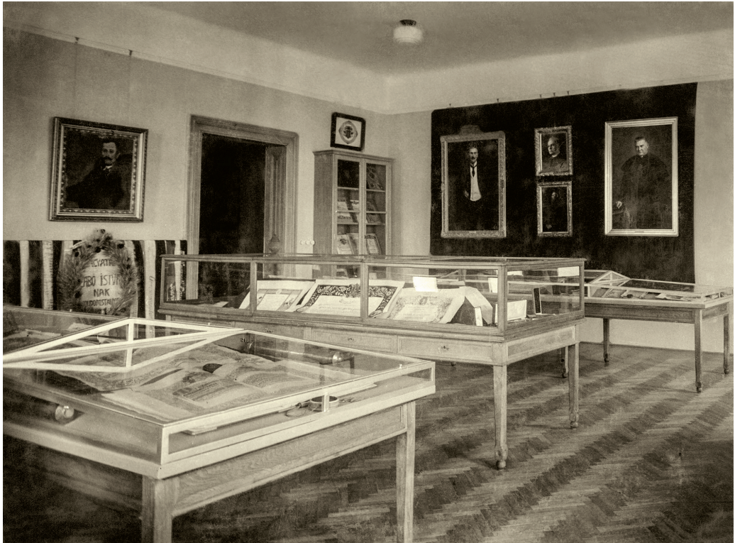
A „legújabb kor” terme a múzeum állandó kiállításán Magyar Nemzeti Múzeum Történelmi Fényképtár