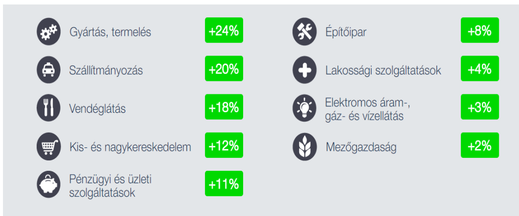
2. ábra: Felvételi szándékok egyes iparágakban 2016. IV. negyedévben

A jelenlegi demográfiai folyamatok következtében csökken a gazdaságilag aktív, a munkaerőpiac kínálati oldalán megjelenő munkavállalók száma.