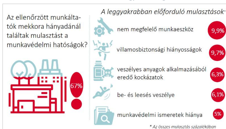
1. ábra: Munkavédelmi ellenőrzések Magyarországon, 2018. 1. félév